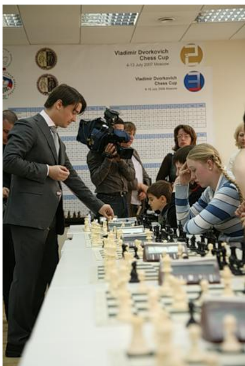
Международный гроссмейстер А.Морозевич проводит для ребят сеанс одновременной игры