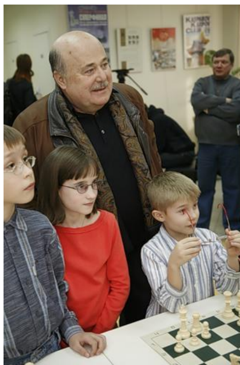
Гость вечера и любимец публики Народный артист России А.Калягин