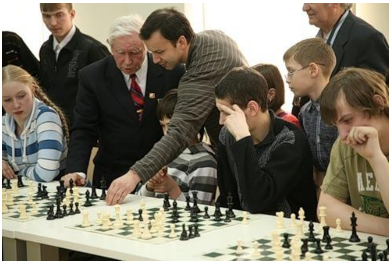
Аркадий Дворкович оценивает позиции