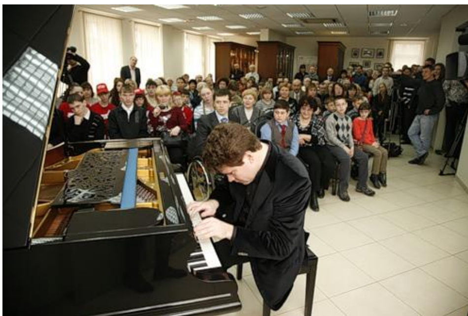
Музыкальное открытие вечера в исполнении Народного артиста России Дениса Мацуева